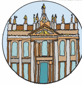
The Dedication of the Lateran Basilica

What is the name of the pope's cathedral? If you said the Vatican, or St. Peter's, you were off by a few miles, since the answer is the Basilica of St. John, the Lateran, the "Mother Church" of all the churches of the world and the cathedral of the Diocese of Rome. It takes its name from the Lateran family, the Trumps of their day, who somehow ran afoul of the Emperor Nero. He seized all their property, including their vast Roman palace and estate.