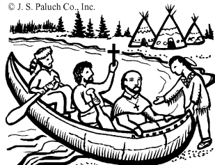
Saints John de Brébeuf, Isaac Jogues, and their companions